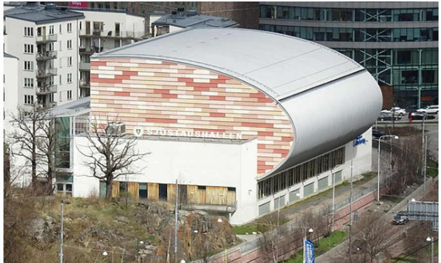
Sjöstadshallen sett från söder.

Sjöstadshallen invigdes år 2005 och är belägen i stadsdelen Hammarby Sjöstad. Hallen består av fyra våningsplan med en idrottshall överst, en före detta gymlokal på mellanplanet och parkeringsgarage i markplanet och källarplanet. Mellanplanet har hyrts ut till ett privat gymföretag, som nu har flyttat ut från lokalerna. Gymlokalen har tidigare hyrts ut som en rå yta, det vill säga utan vare sig innerväggar eller ytskikt, vilket hyresgästen själv har uppfört. De omklädningsrum som tidigare hyresgästen har lämnat kvar saknar tätskikt och behöver därför rivas i sin helhet.